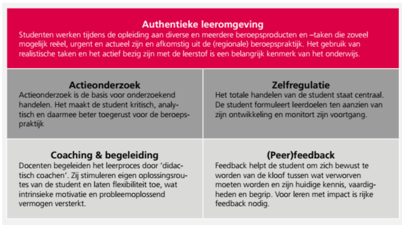
Figuur 1, Didactisch concept

Studenten zijn enthousiast over de ‘echte’ opdrachten. De opleiding slaagt er ook steeds in om alle modules op te hangen aan opdrachten uit de praktijk. Hoewel men streeft naar vernieuwing is niet altijd te voorkomen dat een opdracht meerdere jaren achtereen wordt ingezet. Het panel waardeert dit ‘levensechte’ leren. Sterk zijn ook de hoeveelheid gastlessen die door de praktijk worden verzorgd. Studenten wonen deze gastlessen echter niet altijd bij. De opleiding is in gesprek over mogelijkheden studenten hiertoe te stimuleren en / of het bijwonen van de gastlessen minder vrijblijvend te laten zijn. Het panel moedigt dit aan; net als de opleiding is het panel van mening dat het motiverend is voor een gast spreker om voor een gevulde zaal te staan en dat het zonde is als studenten verrijkende kennis missen.